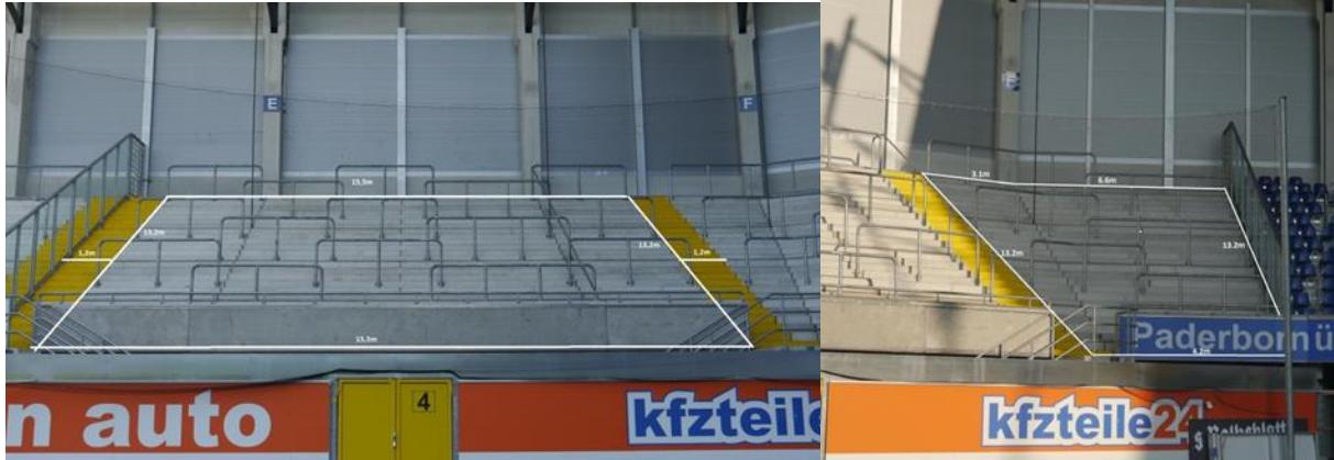
Stehplätze Block E und F, links und rechts ein Treppenaufgang