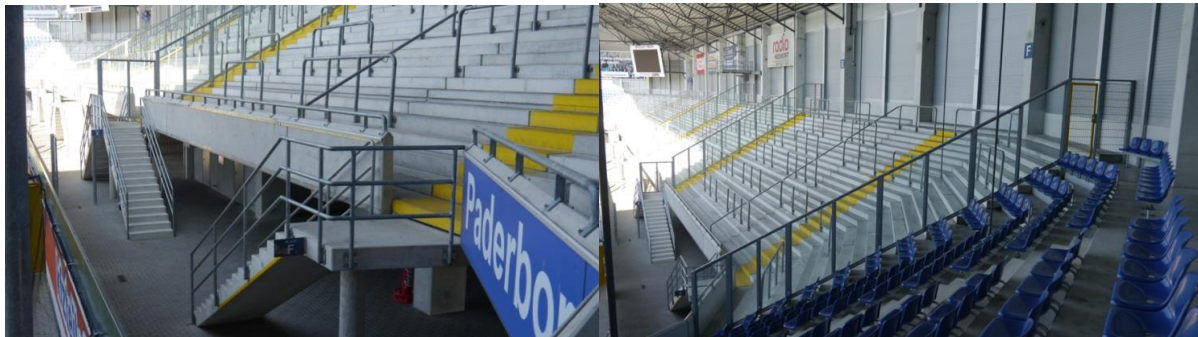
Das Anbringen der Zaunfahnen, ist im hinteren Bereich an den vorgesehenen Befestigungen, sowie an der Werbefreien Brüstung erlaubt.