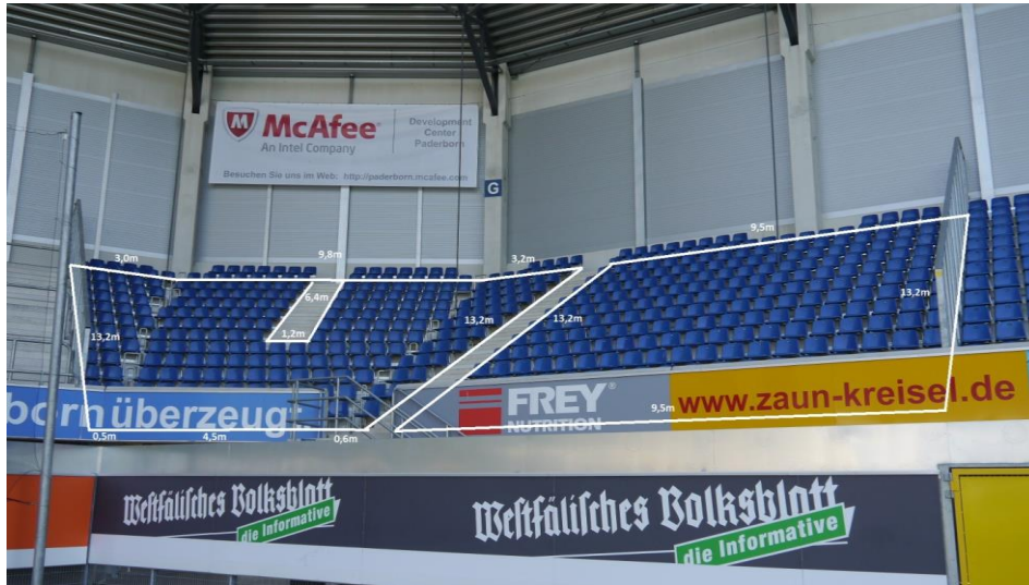
Sitzplätze Block G, ein Treppenaufgang

Ein Anbringen von Zaunfahnen ist an der Betonbrüstung (Werbefläche) nicht erlaubt!